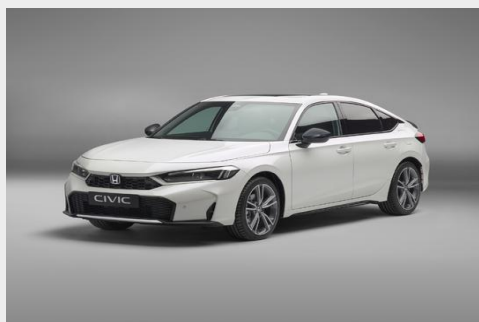
Carbon Style пакет