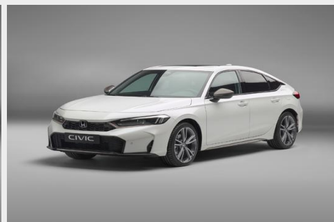
Patina Bronze пакет