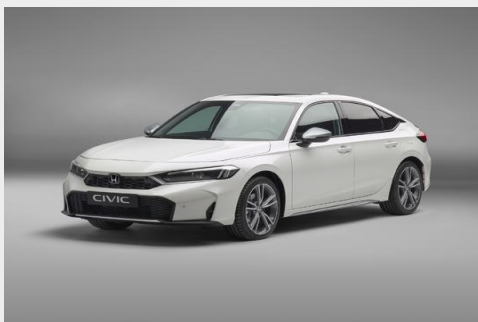
Nordic Silver пакет