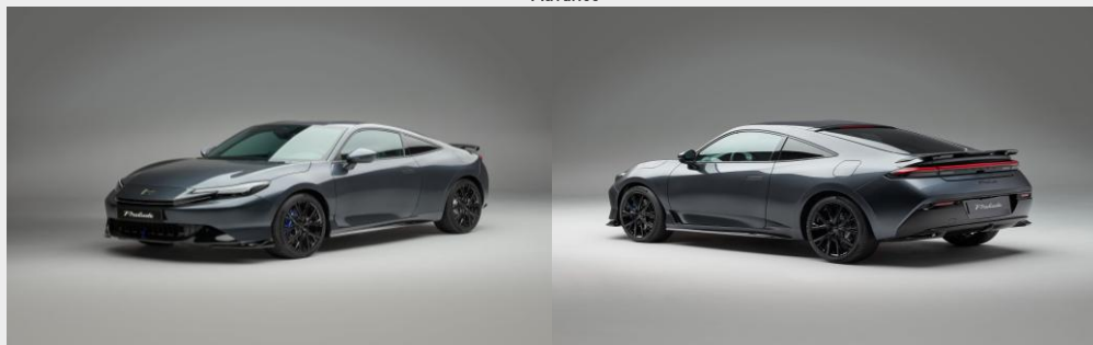
Advance BLACK PACK